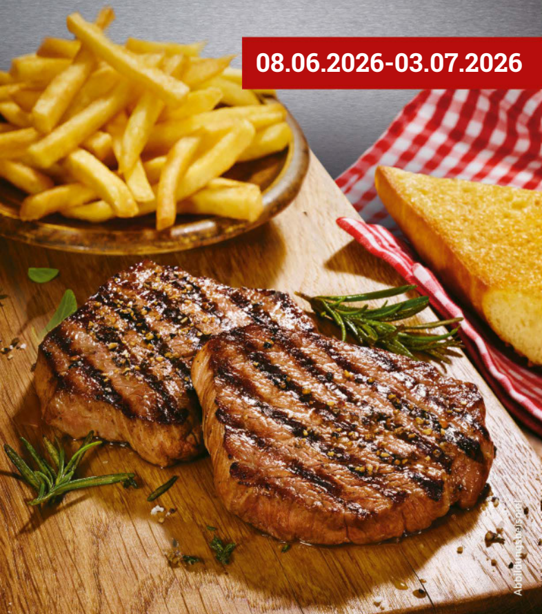
Abbildung ist beispielhaft