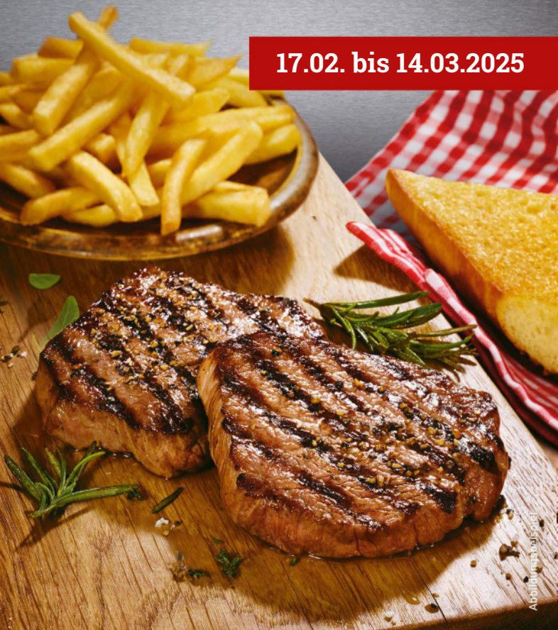
Abbildung ist beispielhaft