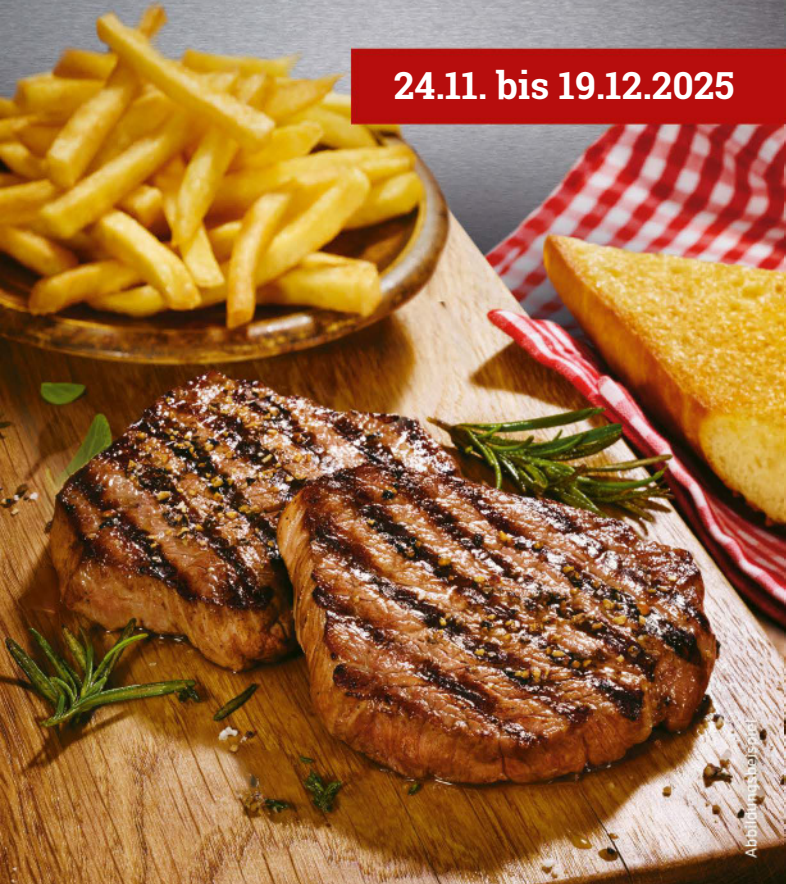
Abbildung ist fiktiv