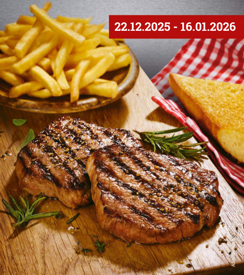
Abbildung ist fiktiv